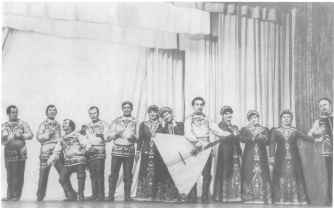
Самодельный ансамбль песни и пляски на сцене Дома культуры